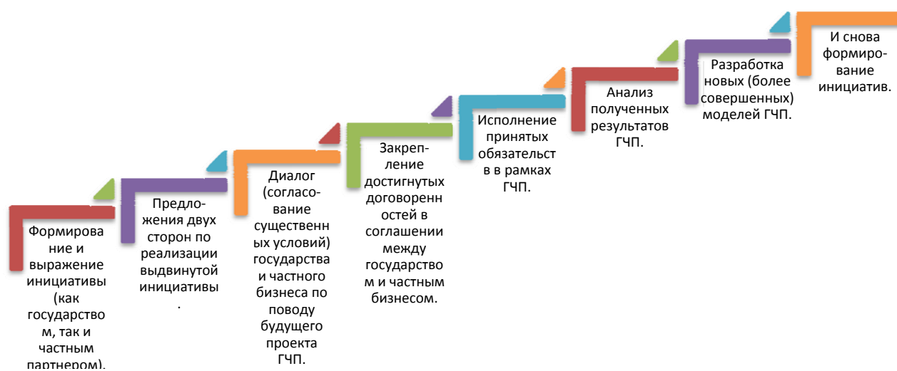
Рисунок 1 – Предлагаемые основные этапы формирования ГЧП в Казахстане

Основными этапами формирования ГЧП в Казахстане предлагаются следующие (рисунок 1):