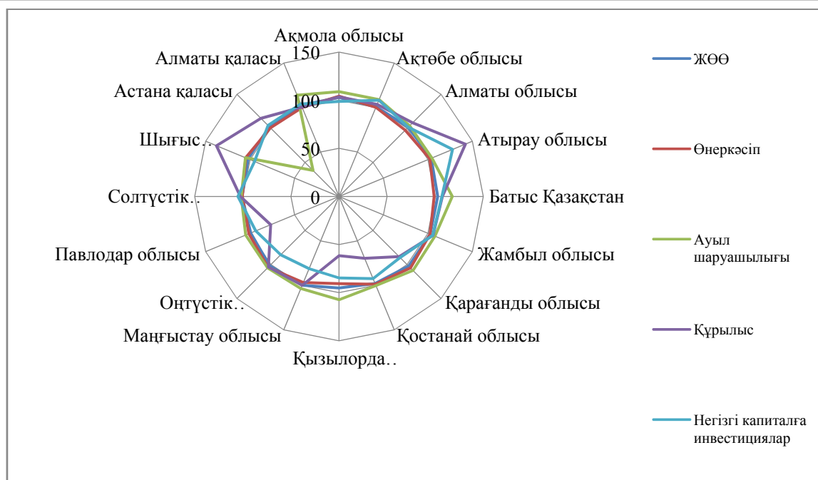
Сурет 2 – Қазақстан Республикасының аймақтарының әлеуметтік-экономикалық даму бойынша көрсеткіштері, 2016 жыл қорытындысы бойынша